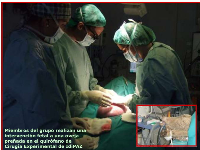
Miembros del grupo realizan una intervención fetal a una oveja preñada en el quirófano de Cirugía Experimental de IdiPAZ

La cirugía pediátrica abarca un amplio espectro de problemas clínicos como traumatismos, tumores, enfermedades inflamatorias y, más concretamente, las malformaciones que, casi siempre, tienen orígenes y mecanismos desconocidos.