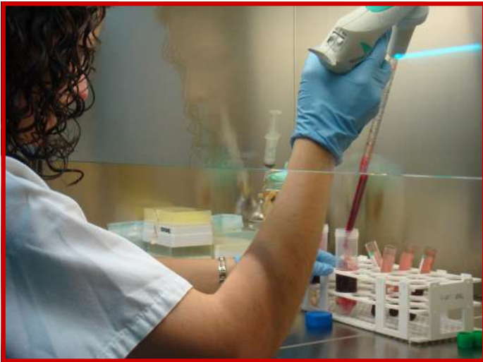
Una investigadora de IdiPAZ trabaja en el Laboratorio de Cultivos Celulares

1.400 publicaciones, 572 ensayos activos y líder en patentes con 6 concedidas y 22 solicitadas